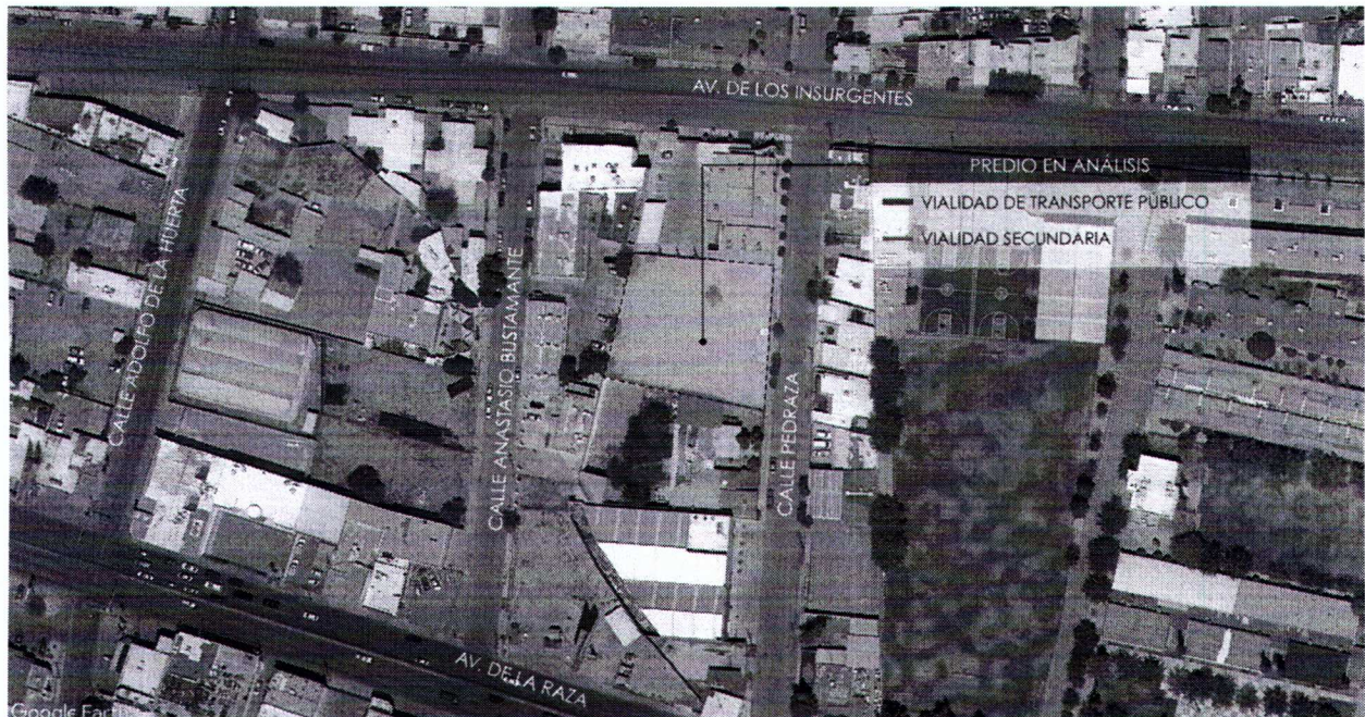
Figura 1. Ubicación del predio. Google Earth 2023.

Vistos para resolver respecto solicitud de una Modificación Menor al Plan de Desarrollo Urbano Sostenible para el Centro de Población de Ciudad Juárez Chihuahua 2016 (PDUS) presentada ante esta Comisión que consiste en un cambio de zonificación secundaria de un predio con una zonificación SH-5/80: Servicios y Habitacional a una zonificación MX-4: Mixto Habitación – Servicios - Industria de un predio ubicado en la calle Manuel Gómez Pedraza número 623 del fraccionamiento el Colegio de esta ciudad con una superficie total de 1,745.55 m 2 . (Ver figura 1)