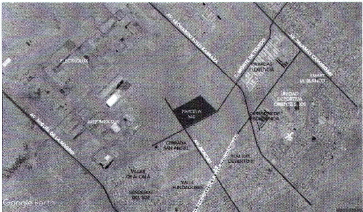
Figura 1. Ubicación del predio.

Vistos para resolver respecto solicitud de una factibilidad de Modificación Menor al Plan de Desarrollo Urbano Sostenible para el Centro de Población de Ciudad Juárez Chihuahua 2016 (PDUS) denominado " Parcela 544 " presentada ante esta Comisión que consiste en un cambio de zonificación secundaria de un predio con una zonificación ZPC: Zonas con Potencial de Crecimiento a HEp1-40 Habitacional Ecológico Pluvial 1, con una densidad de hasta 40 viviendas por hectárea , de un predio ubicado en Parcela 544 Z-5 P9/9, del Ejido, intersección nororiente de la C. Monte de Toledo y Av. Acacias, al suroriente de la ciudad, con una superficie de 199,721.46 m² . (Ver figura 1)